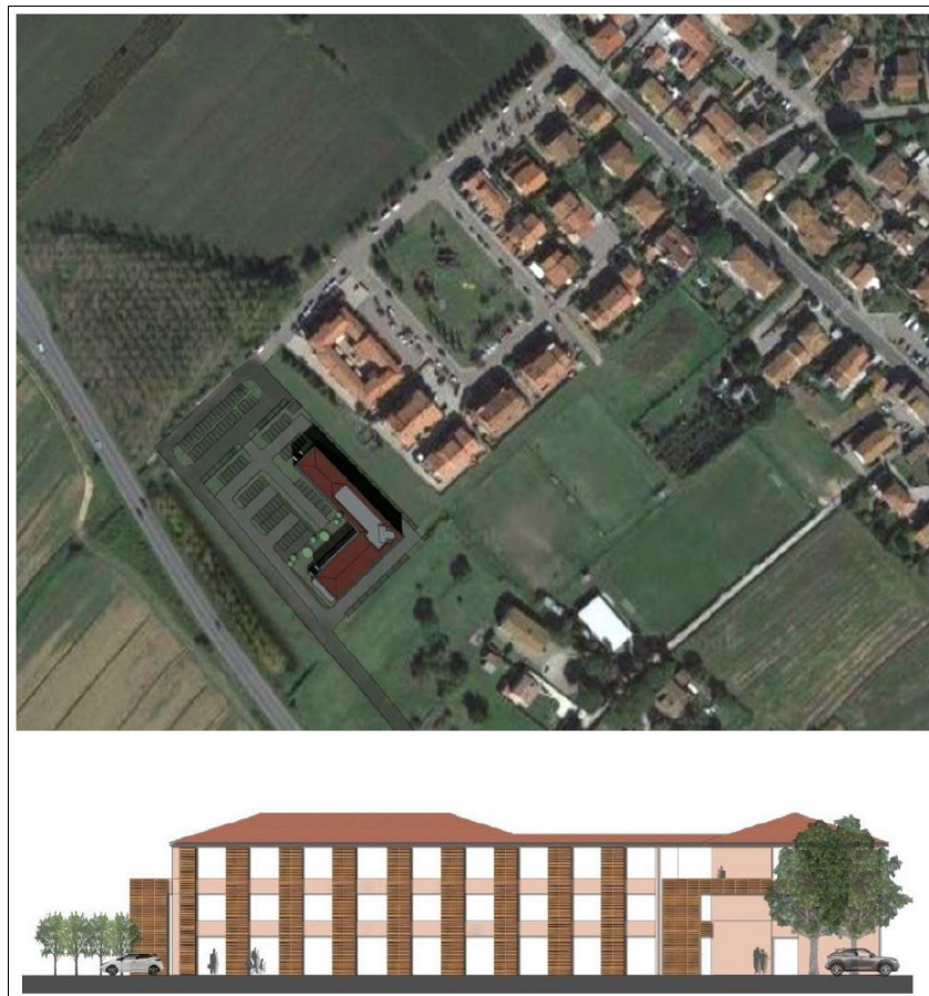
Figura 4 – Inserimento plani-aerofotogrammetrico ed un prospetto laterale RSA – I Fabbri

Pertanto si dovrà assicurare che la nuova espansione e il nuovo carico insediativo sia coerente per tipo edilizio, materiali, colori ed altezze, e opportunamente inserito nel contesto paesaggistico senza alterarne la qualità morfologica e percettiva. A tale fine è stato prodotto inserimento plani-aerofotogrammetrico ed un prospetto laterale al fine di poter comprendere nel dettaglio l'intervento previsto in rapporto al contesto insediativo.