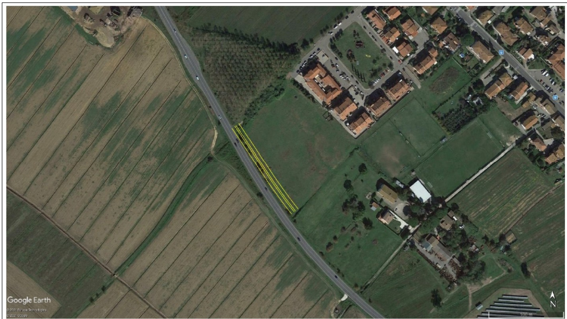
Figura 6 – Posizione indicativa della duna acustica

Per giustificare suddetta variazione di classe acustica, sarà definito un elemento mitigativo, rappresentato nel caso in oggetto da una duna in terra da scavo opportunamente vegetata, definita ed ottimizzata mediante modellazione acustica. L'altezza del terrapieno sarà pari ad almeno 4.5 metri, con una larghezza sommitale di 2 metri; la posizione indicativa è visibile nella figura di seguito rappresentata.