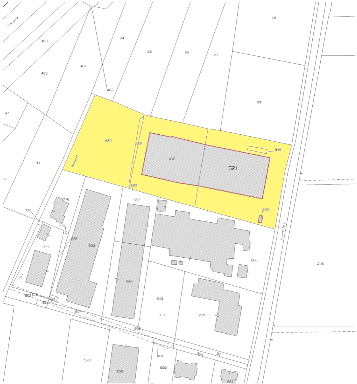
Estratto mappa catastale Comune di Bientina Foglio 17